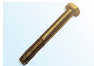
Зображення 2: «Оригінальний» гвинт