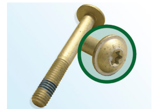
Зображення 3: Гвинт LuK-AS

В рамках постійного вдосконалення нашої продукції і гарантії якості LuK-AS поставляє новий гвинт (зображення 3) з натяжним роликом 531 0274 30.